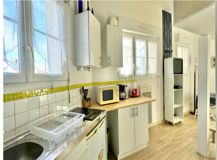
Studio rénové à La Genette avec terrain à proximité

Découvrez ce charmant studio de 18 m 2 , idéalement situé au coeur du quartier de La Genette. Intelligemment rénové, ce studio dispose d'un coin nuit en mezzanine, optimisant l'espace de vie. Entièrement meublé, il est prêt à vous accueillir.